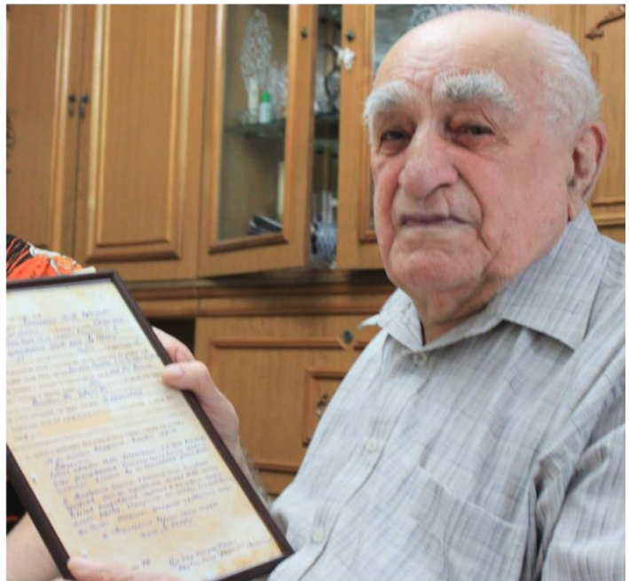
Награда нашла своего героя (результат нашего поиска)