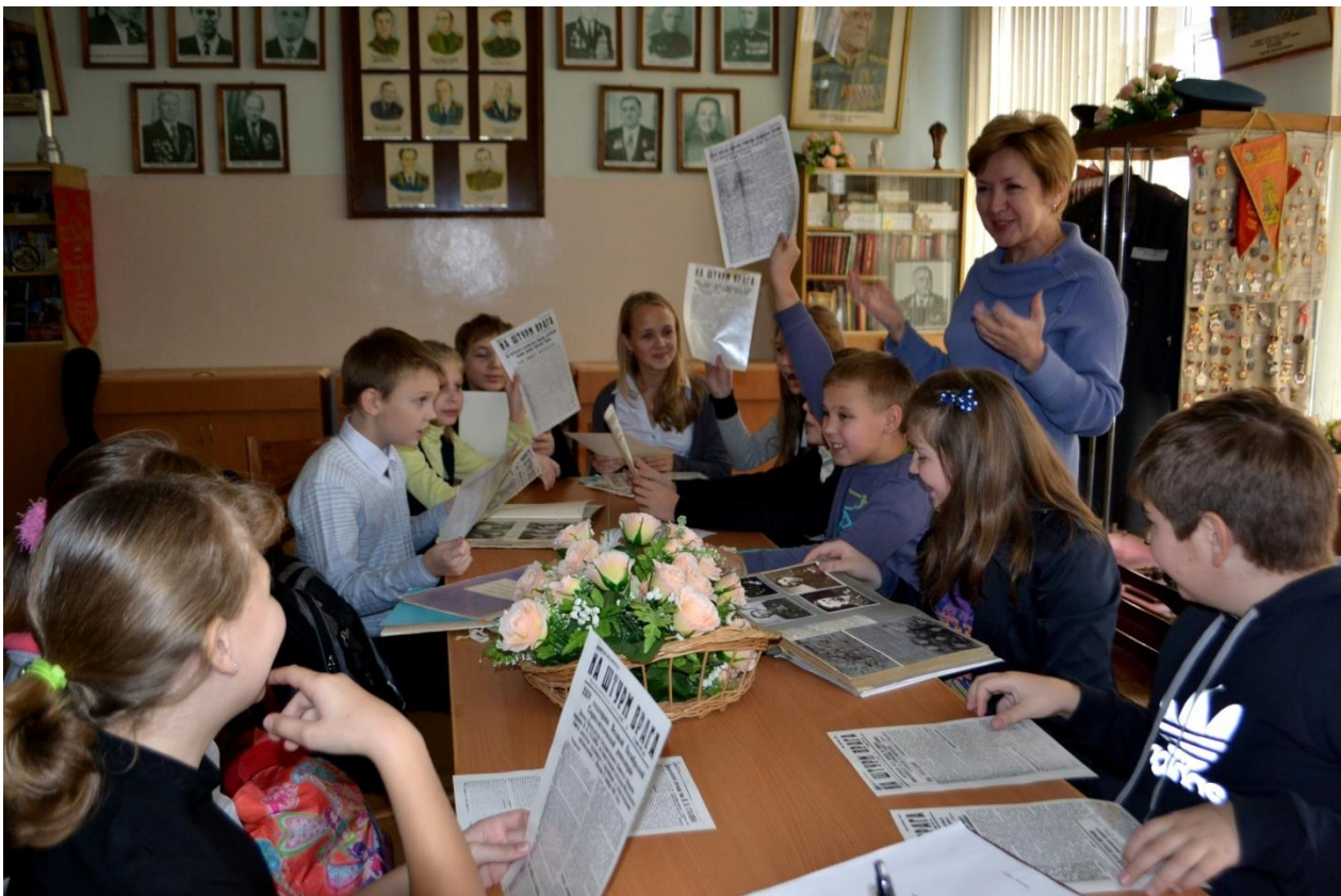
Совет музея за работой